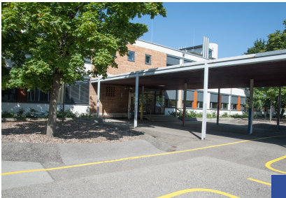
Dachauer Straße 98

Unsere Schule besuchen Kinder und Jugendliche mit sonderpädagogischem Förderbedarf in den Bereichen Lernen, Sprache und emotional-soziale Entwicklung. Wir fördern unsere SchülerInnen in Lerngruppen mit differenzierten sonderpädagogischen Angeboten.