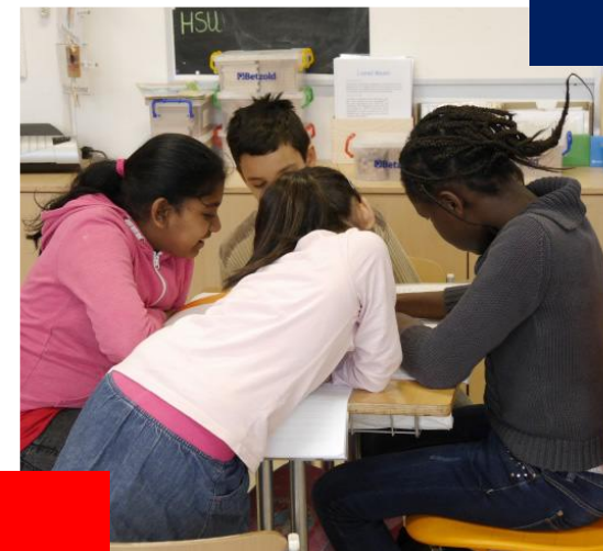
Sonderpädagogisches Förderzentrum München Mitte 1