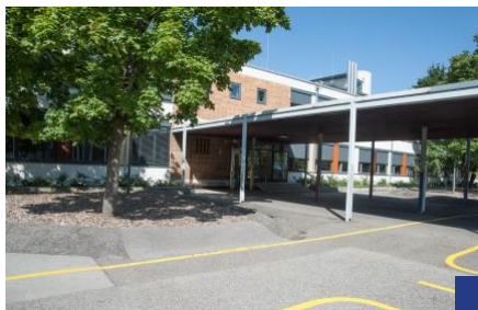
Dachauer Straße 98

Unsere Schule besuchen Kinder und Jugendliche mit sonderpädagogischem Förderbedarf in den Bereichen Lernen, Sprache und emotional-soziale Entwicklung.